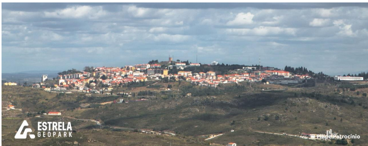
Figura 3. Vista para a Cidade da Guarda.