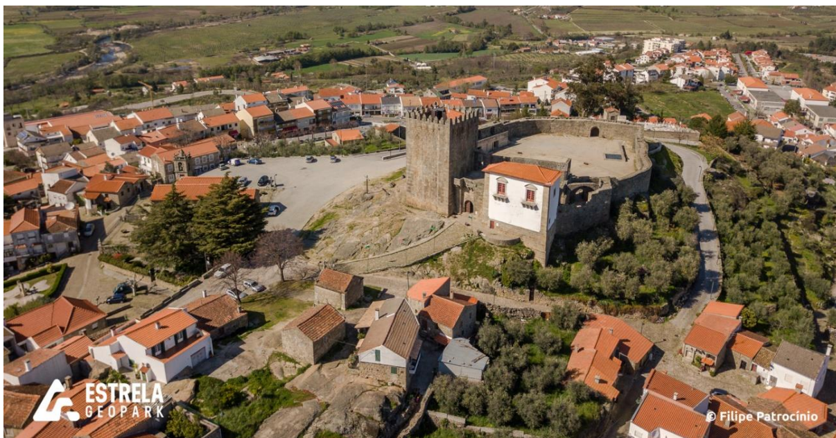
Figura 2. Vista aérea para o Castelo e Vila de Belmonte.